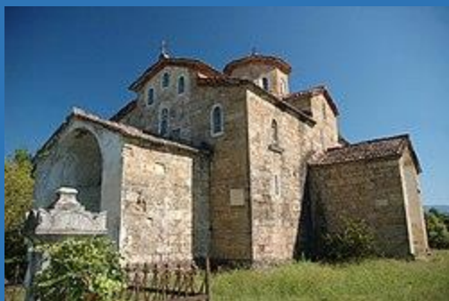
ლიხნის ღვთისმშობლის სახელობის ეკლესია

მდებარეობს სოფელ ლიხნში, გუდაუთაში. თარიღდება მეათე საუკუნით. ცნობილია ქართული წარწერებით, რომლებშიც მოიხსენიებიან სქართველოს მეფეები, ბაგრატ მეოთხე და გიორგი მეორე. 1066 წლის წარწერა გვამცნობს ჰალის კომეტის გამოჩენის შესახებ. შემორჩენილია მე-10-მე-11 და მე-14 საუკუნის ფრესკები.