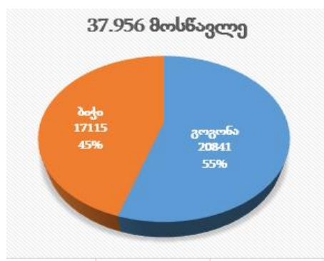
2018-2019 სასწავლო წელი